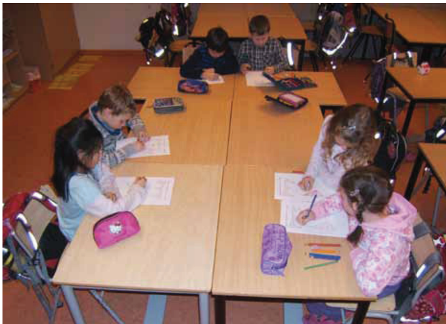
Elevene på 2. trinn ved Smeaheia skole har hatt russiskinspirert matematikkundervisning siden de begynte på skolen.

– I Norge legges det stor vekt på formelinnetting, og det å finne et svar med to streker under. Mangelen på trening i å resonnerer og analysere er derfor en merkbar utfordring også blant våre studenter. Jeg tror at vi som underviser i matematikk, på alle nivåer, har litt for lett for å komme med løsninger, uten å bruke nok tid på hva som faktisk er problemet, mener Hag.