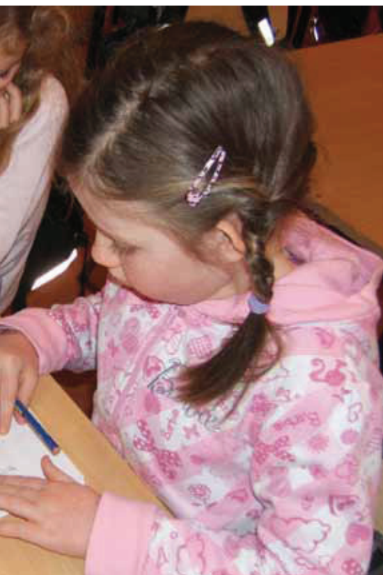
geometriske figurer.